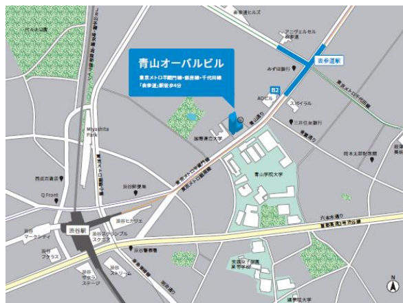
アクセス 「表参道駅」B2出口 徒歩4分（青山道り沿い）